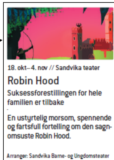
Innside 100% størrelse