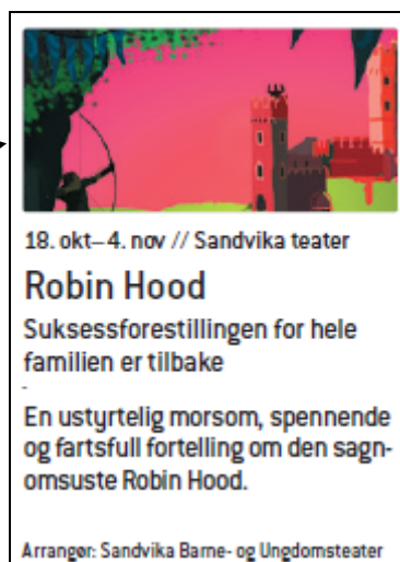
Innside 100 % størrelse